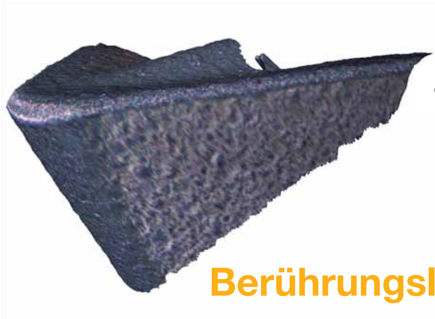
InfiniteFocus visualisiert die Oberfläche der Schneidkante auch als 3D Modell